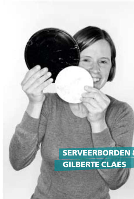
SERVEERBORDEN & SCHALEN GILBERTE CLAES

Waar? Te koop bij Stulens in Hasselt ( www.stulens.be ).